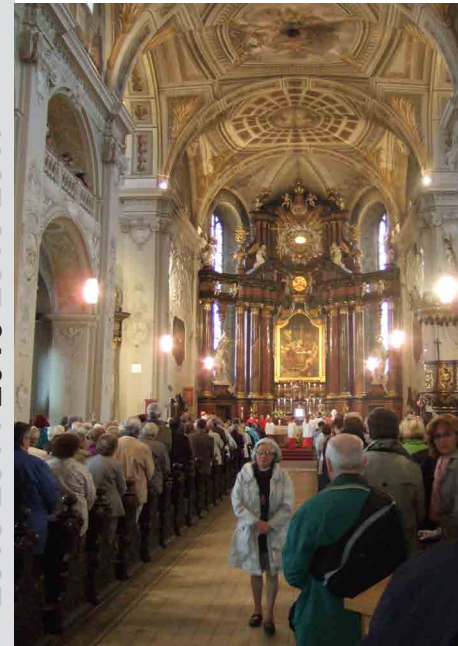
Wallfahrtsmesse der Flüchtlinge und Heimatvertriebenen in der Basilika Walldürn, 21. Juni 2015

Mit einer Feldforschungsarbeit unter Mitwirkung von Freiburger Studierenden bei der 70. Wallfahrtsveranstaltung der Heimatvertriebenen und Aussiedler im Juni in Walldürn, mit weiteren Materialaufnahmen aus den einschlägigen Bestandsgruppen im IVDE sowie aus der Bibliothek des Erzbischöflichen