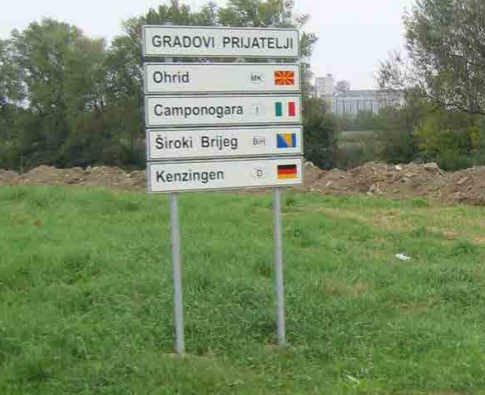
Freund- und Partnerschaftenschild am Stadteingang von Vinkovci, Kroatien

weisern, die nicht nur die Himmelsrichtung, sondern auch die Entfernung zu der jeweiligen verschwisterten Gemeinde angeben. Freund- oder Partnerschaftsbäume rekurren verschiedentlich auf nationale Symboliken, aber auch auf eine „sprechende“ Symbolik wie z. B. fruchttragende Bäume. Nicht unerheblich ist auch der jeweilige Standort oder die Örtlichkeit. Zentrale Lagen von einschlägig benannten Straßen, Plätzen, Schildern, Plaketten oder Bäumen unterstreichen die hohe Bedeutung der Verbindung. Ähnliches kann für Umbenennungen von Straßen und Plätzen gelten. Indem sich die (Klein-)Denkmale in der mental map der Einwohner verankern, halten auch die kommunalen Beziehungen Einzug in den alltäglichen Diskurs der Bürgerschaften. Hier bedarf es jedoch der steten Erinnerung an den Grund der Denkmalsetzung, sonst kann der von Robert Musil beschriebene Effekt eintreten, nach dem Denkmale mit der Zeit gegen die Aufmerksamkeit der Passanten imprägniert werden.