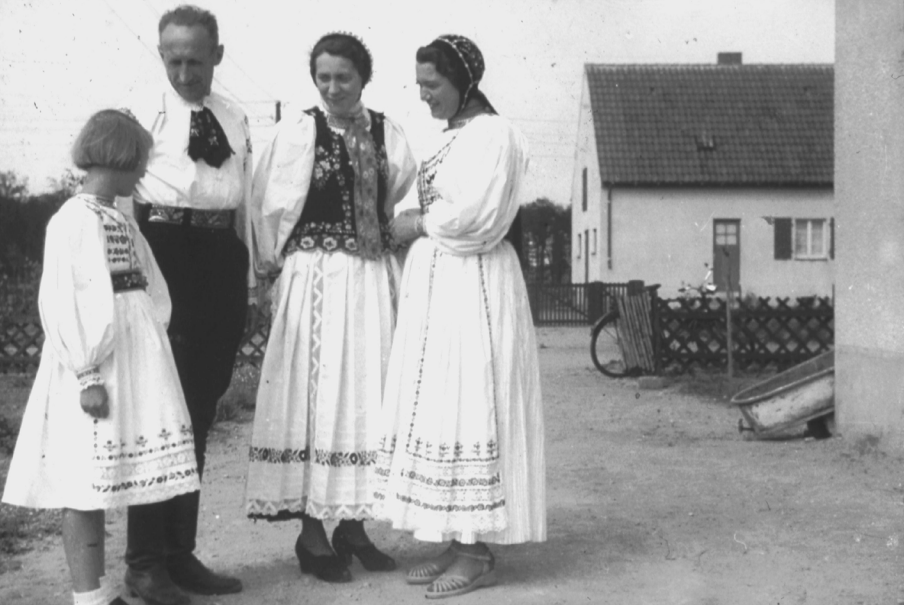
Siedler in ihren Trachten aus der „alten“ Heimat vor ihren neuen Häusern in der Reichswaldsiedlung; Signatur Dx00575