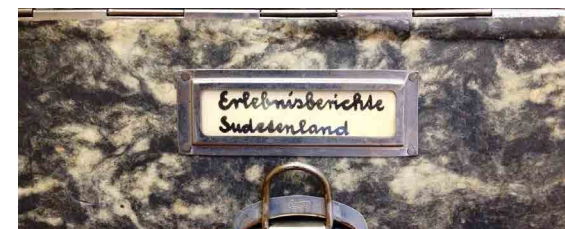
Schuber mit den von Johannes Künzig gesammelten Erlebnisberichten

Im Archiv der Einsendungen findet sich eine Sammlung an maschinellen und handschriftlichen Zeitzeugenberichten von aus Böhmen und Mähren vertriebenen Deutschen. Diese biographischen Zeugnisse geben Auskunft über Ausweisung, Umsiedlung, Flucht und Vertreibung nach dem Zweiten Weltkrieg.