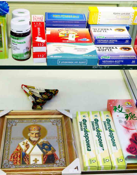
Verkaufsvitrine im Lebensmittel- geschäft für russische Spezial- itäten „ELISA“ in Lahr