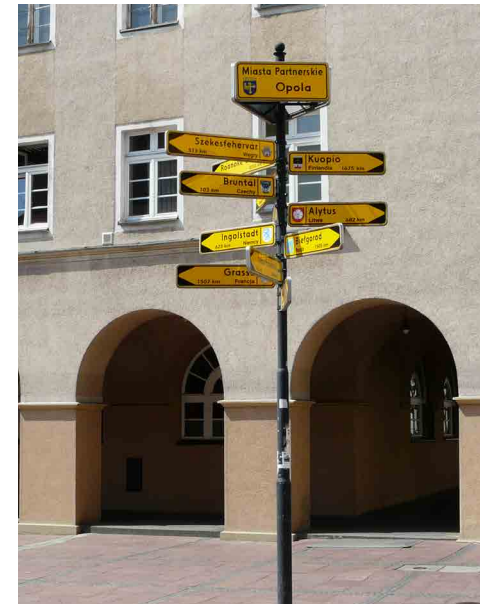
Partnerschaftenwegweiser neben dem Rathaus in Opole/Polen

Versteht man die Markierungen einer Partner- oder Freundschaft als oder wie eine Art (Klein-)Denkmal, dann bieten sich die Erkenntnisse der Denkmalforschung zur Beantwortung vorgenannter Fragen an. Diese Denkmale fungieren nicht nur als Orte, mittels derer an die Entwicklung der Verbindungen erinnert werden soll, vielmehr sind sie auch eine stete Aufforderung an die Bürgerschaften, die Beziehungen weiterhin zu pflegen. Gegenüber Dritten sollen solche Erinnerungsorte die Weltläufigkeit, Modernität und internationale Orientierung der jeweiligen Kommune unter Beweis stellen. Bei manchen Markierungen liegt die Symbolik auf der Hand, etwa bei Weg-