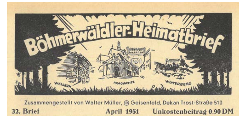
Titelvignette des Böhmerwäldler Heimatbriefs ab Juni 1949 (10.1949 – 63.1953)

Wallern, Prachatitz und Winterberg – diese drei Städte und die umliegenden Gemeinden stehen im Fokus des „Böhmerwäldler Heimatbriefs“ (Titel seit 2019 „Der Böhmerwald“), in der obigen Titelvignette emblematisch in Form von Wahrzeichen abgebildet: Ein Holzhaus für Wallern / Volary, das Untere oder Piseker Tor von Prachatitz / Prachatice und das Schloss Winterberg / Vimperk. Auch Leser ohne visuelle Hintergrundinformationen, die nie vor Ort waren und nicht über das für die Deutung der Wahrzeichen notwendige Wissen verfügen, können durch die Angabe der Ortsnamen eine Zuordnung vornehmen.