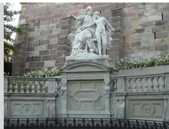
Donauquelle in Donaueschingen