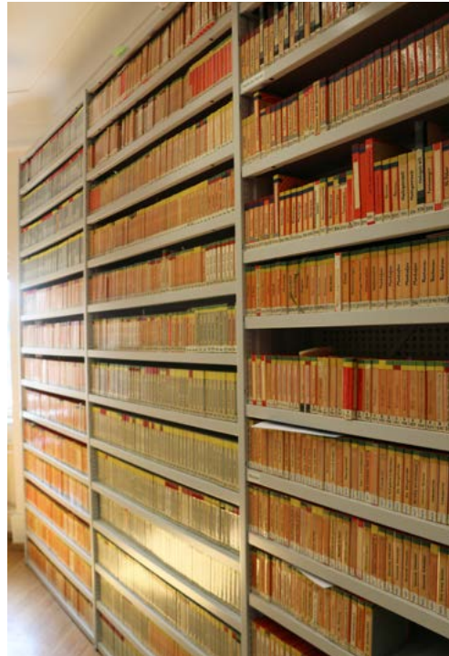
Blick in das Tonarchiv nach dem Umbau.

Das Tonarchiv des IVDE versammelt auf über 1 200 Tonbändern, die inzwischen komplett digitalisiert sind, vor allem Interviews mit Heimatvertriebenen und Flüchtlingen aus dem östlichen Europa. Die von Johannes Künzig und Waltraut Werner-Künzig in den 1950er- und 1960er-Jahren aufgezeichneten „ostdeutschen“ Tonbandaufnahmen bilden dabei den Grundstock. Sie dokumentieren neben Schilderungen der Arbeits- und Lebenswelt vor 1945 vor allem Sagen, populäres Liedgut und Feste im Jahres- und Lebenslauf. Darüber hinaus wurden Erfahrungen im Zusammenhang mit Krieg, Flucht und Vertreibung und der Integration in die Nachkriegsgesellschaft aufgezeichnet. Die zu den Tonbändern erstellten Regesten waren bereits auf Grundlage einer differenzierten Systematik erschlossen und sind für Nutzerinnen und Nutzer gut zugänglich. Ergänzt werden die Originalbänder durch thematisch geordnete Tonträger, auf denen ausgewählte Inhalte der „ostdeutschen“ Tonaufnahmen etwa nach Gattung, „Gewährspersonen“ oder Herkunftsgebieten