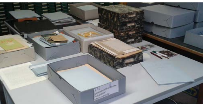
Vorsortierung der Nachlass-Dokumente für eine spätere Katalogisierung.

1951 gründete Künzig, ausgehend von seinen Forschungen aus der Vorkriegszeit, die „Zentralstelle für Volkskunde der Heimatvertriebenen“, um die Traditionen der Vertriebenen vor dem Vergessen zu bewahren. Nach dem Zweiten Weltkrieg führte er seine Arbeit im Ausland fort und unternahm Forschungsreisen nach Jugoslawien, Rumänien und Ungarn. Auf diese Weise gelang es ihm, die beiden geographischen Forschungsräume, Baden und die deutschen Siedlungsgebiete im östlichen Europa, zu verbinden. In den 1950er-Jahren veröffentlichte er verschiedene Arbeiten über deutsche Vertriebene und Aussiedler, die in Baden ansässig geworden waren.