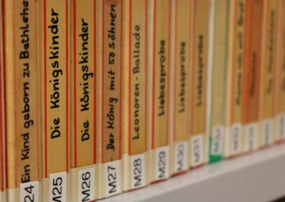
Tonbänder mit der Signatur M, Märchen.