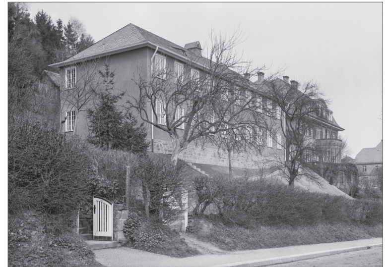
Neubau von 1927 und Altbau (rechts) der „Deutschen Burse zu Marburg“