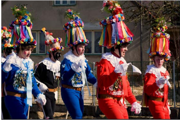
Masopust / Fastnacht in Votová, Tschechien; © Ralf Siegele, 2011.

Die Bedeutung solcher Projekte wird auch von politischen Entscheidungsträgern zunehmend wahrgenommen und geschätzt. In ersten Gesprächen zeigte beispielsweise das Ministerium für Justiz und Europaangelegenheiten Baden-Württemberg aufgrund der europäischen Dimension der Datenbank Interesse an einer Verlinkung der folklore europaea auf der offiziellen Website des Ministeriums.