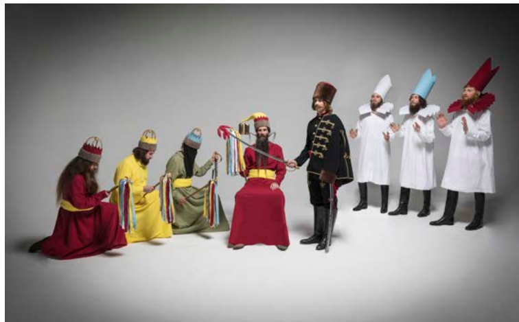
Michael Wilke, „Der Traum der Könige“: Der Hauptmann verkündet Herodes den erfolgten Kindermord, die Schriftgelehrten schrecken entsetzt zurück; Digitaldrucktapete, 250 x 375 cm.

Neben historischen Fotografien, Augenzeugenberichten, Spieltexten und Kostümbeschreibungen stellten für ihn Tonaufnahmen aus dem Tonarchiv des IVDE, die 1960 bei einem Treffen der Karpatendeutschen in Karlsruhe aufgenommen worden waren, wichtige Impulse dar. Sie sollen „in einer zukünftigen Ausstellung Teil einer atmosphärisch dichteren Inszenierung sein“ (Portfolio Michael Wilke, https://drive.google.com/file/d/1xoKmwXhL1rwHQRnuYa_Xp4FsZ5ji-3qM/view ).