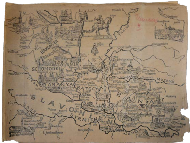
Bildlandkarte des donauschwäbischen Raums, vermutlich als Vorlage für einen Buchumschlag.

im Gange, so dass das Archiv für die Öffentlichkeit noch nicht zugänglich ist. Seinen besonderen wissenschaftlichen Wert besitzt das Archiv wegen der vielfältigen Kontextualisierungsmöglichkeiten. Cammann hat nämlich umfangreiche Notizen zum Zustandekommen der Kontakte und Erzählungen angefertigt. Ferner hat er die Aufzeichnungsbedingungen ausführlich festgehalten. Darüber hinaus gehört auch der umfangreiche Schriftverkehr mit den Interviewpartnerinnen und -partnern zum Archiv. Seine Bedeutung besitzt das Archiv nicht nur für die Fachgeschichte des „Vielnamenfaches“ Volkskunde und seiner Untersuchung der Kultur der deutschen Vertriebenen. Vielmehr bietet das Archiv auch einen übergroßen Quellenfundus für volkskundliche, aber auch germanistische und historiografische Untersuchungen, gerade weil heute ganz andere Fragen an die Archivalien gestellt werden als zu Cammanns Zeiten.